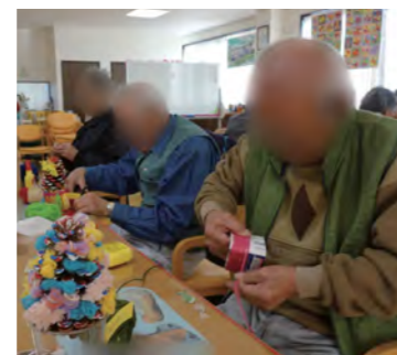
作業レクリエーション

その他、認知症予防トレーニング、運動レクリエーション、健康づくりの資料配布などを行っています。