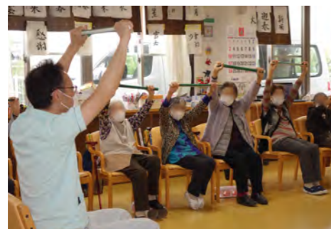
理学療法士等によるリハビリ