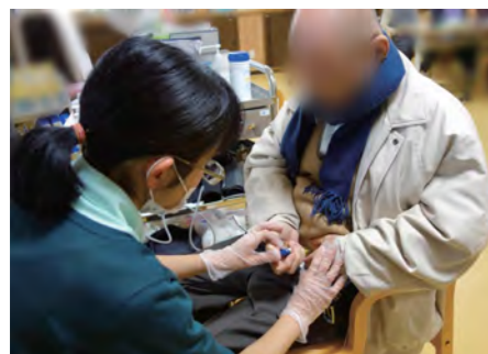
看護師による体調管理